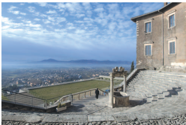
Veduta panoramica dal Museo di Palazzo Borghese di Palestrina

Per iscriversi al Master è indispensabile il possesso di una laurea triennale, magistrale o di vecchio ordinamento in Architettura - Conservazione o Scienze dei Beni Culturali - Lettere e Filosofia - Scienze Ambientali, Geologiche o del Turismo - Scienze e Tecnologie Chimiche, Fisiche o Informatiche - Scienze e Tecnologie per l'Ambiente e il Territorio - Tecnologie per la Conservazione e il Restauro dei Beni Culturali o simili. Il Comitato Ordinatore si riserva comunque di valutare caso per caso l'eventuale equipollenza o ammissione di altri titoli di studio.