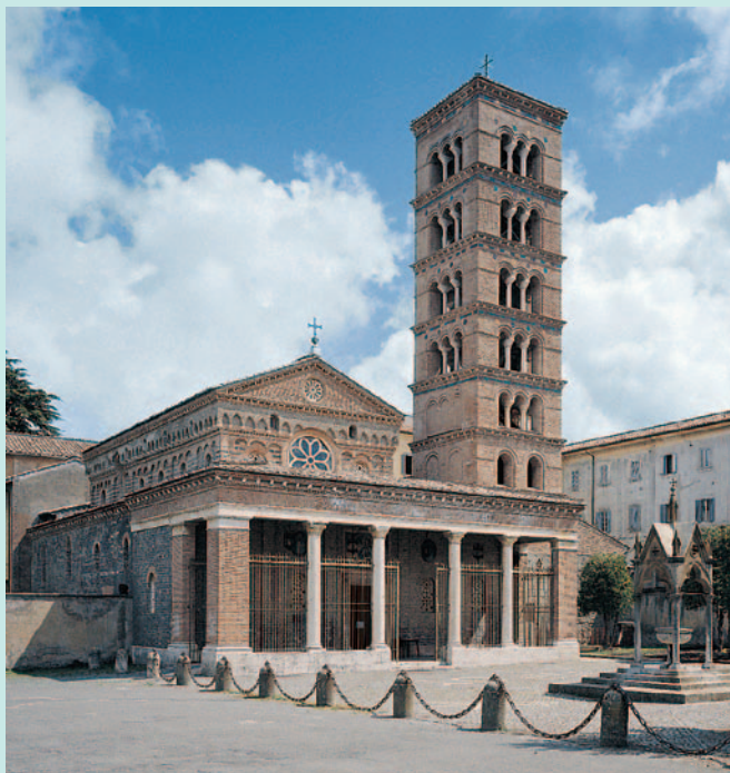
Chiesa di Santa Maria a Grottaferrata (Abbazia san Nilo)

Il Comitato Ordinatore si riserva comunque di valutare caso per caso l'eventuale equipollenza o ammissione di altri titoli di studio.